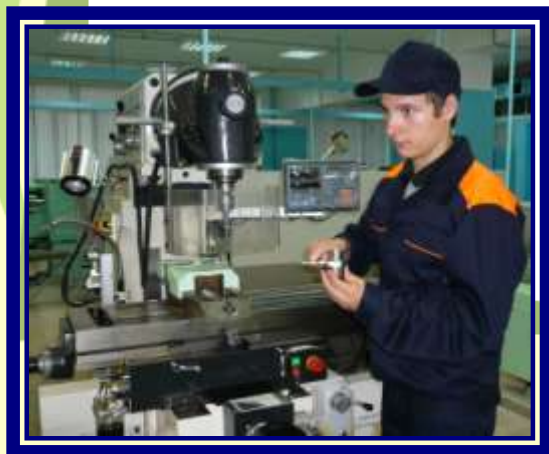
Станочник широкого профиля