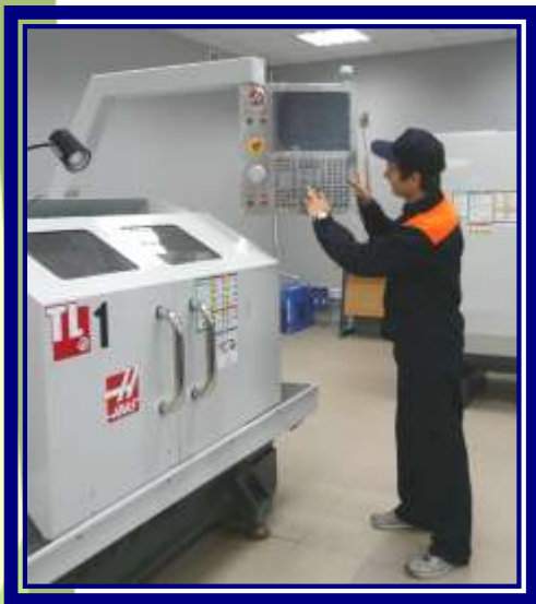
Оператор станков с ЧПУ