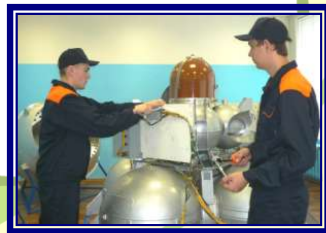
Слесарь (слесарь-инструментальщик; слесарь механосборочных работ)